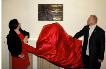
Горан Весић открива спомен-плочу

Горан Весић је подсетио да се данас обележава 99 година од завршетка Првог светског рата у коме је Србија, као и увек, била на правој страни.