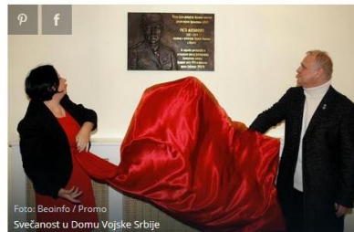
Svečanost u Domu Vojske Srbije